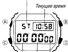
Текущее время Минуты Секунды Сотые доли секунды

Режим секундомера дает вам возможность измерять отдельные отрезки времени, промежуточное время, а также фиксировать два первых результата в соревнованиях. Максимальный диапазон измеряемого секундомером времени составляет 23 часа 59 минут 59,99 секунды.