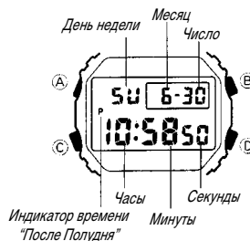
Индикатор времени "После Полудня"