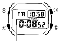
Индикатор автоматического повтора